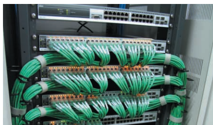
▲ システムに導入されたDGS-3427/3450

D-Linkでは課題解決のためにエンジニアが直接対応することが少なくない。クライアントからの報告に対応し、バグ修正や機能追加を施したファームウェアをスピーディにリリースしていく。また技術に明るい人材が多いため、現象を把握するまでの時間が短いのもポイントだ。「問題が起きても素早く対処してくれる。これは、研究現場から見ても頼もしいパートナーです」丹博士は、そうインタビューを締めくくってくれた。